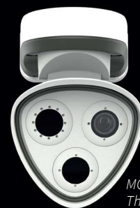
MOBOTIX M73 Thermal/TR

T & B electronic ZAŠTITA OD VATRE Made in Germany